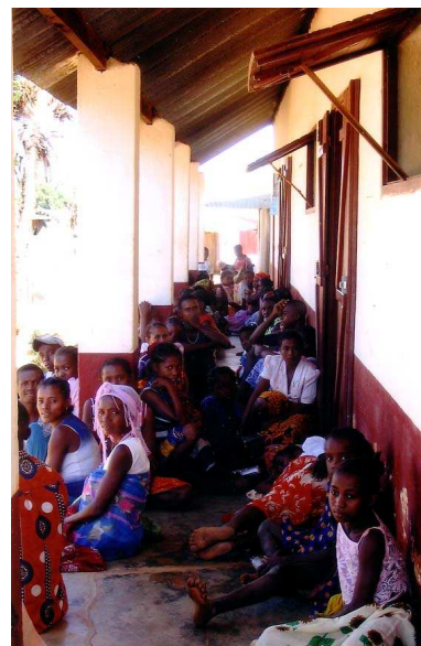
Attente sous le haut vent de l'hôpital

(Voir le compte rendu sur le site www.echangenonmarchand.org du responsable de Tefy Saina).